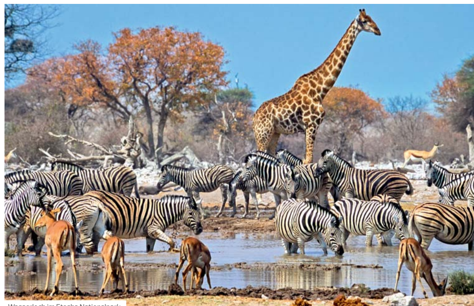
Wasserloch im Etosha Nationalpark