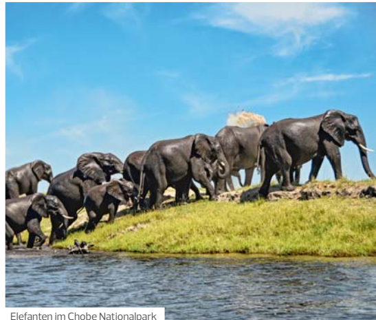
Elefanten im Chobe Nationalpark